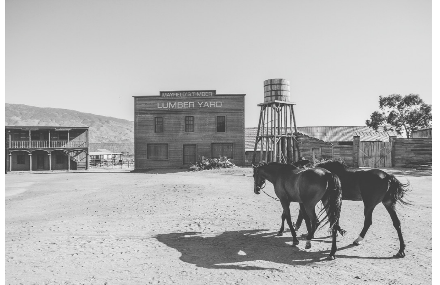
ROSER ARQUÉS MORUETA