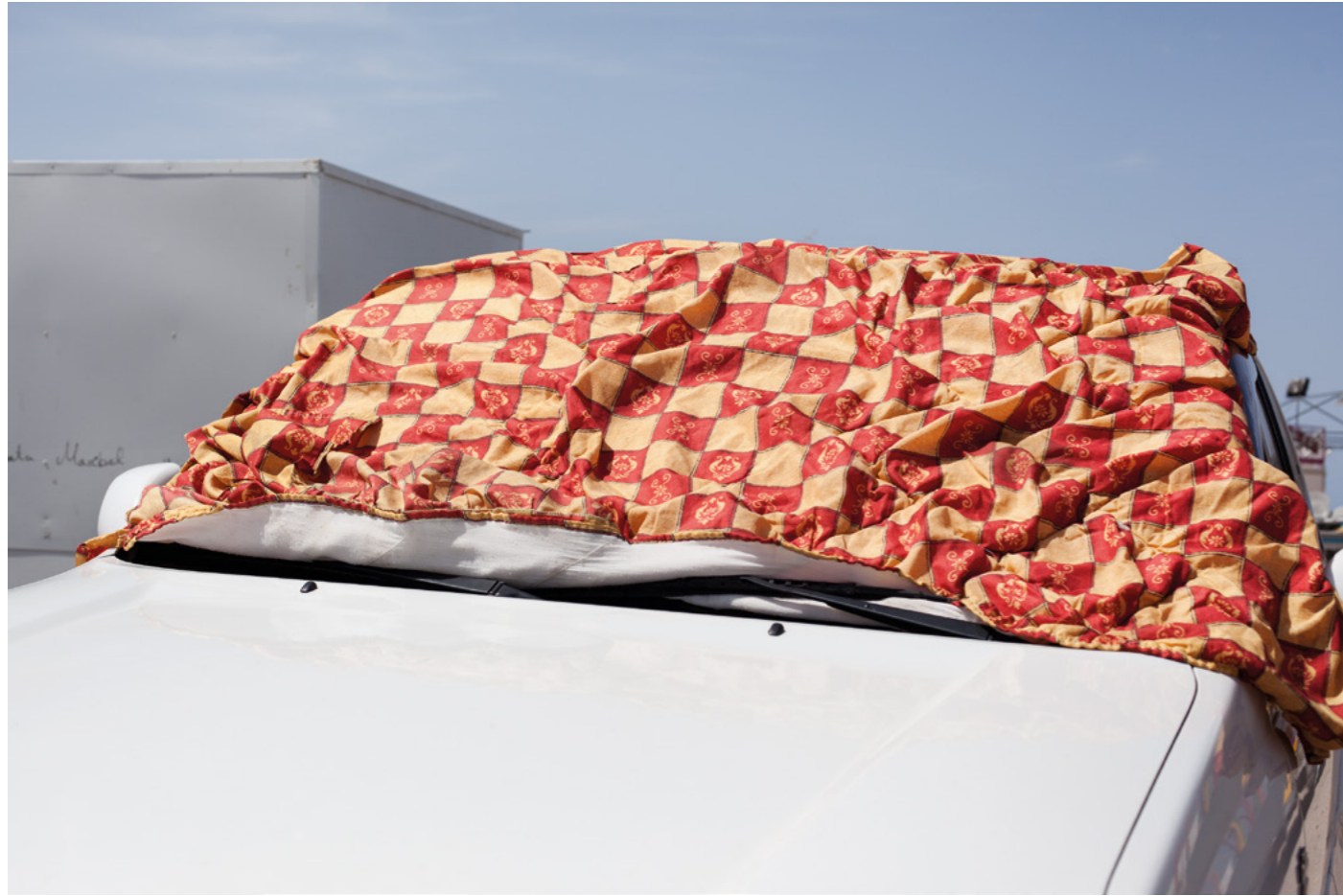
OESTE VS WESTERN