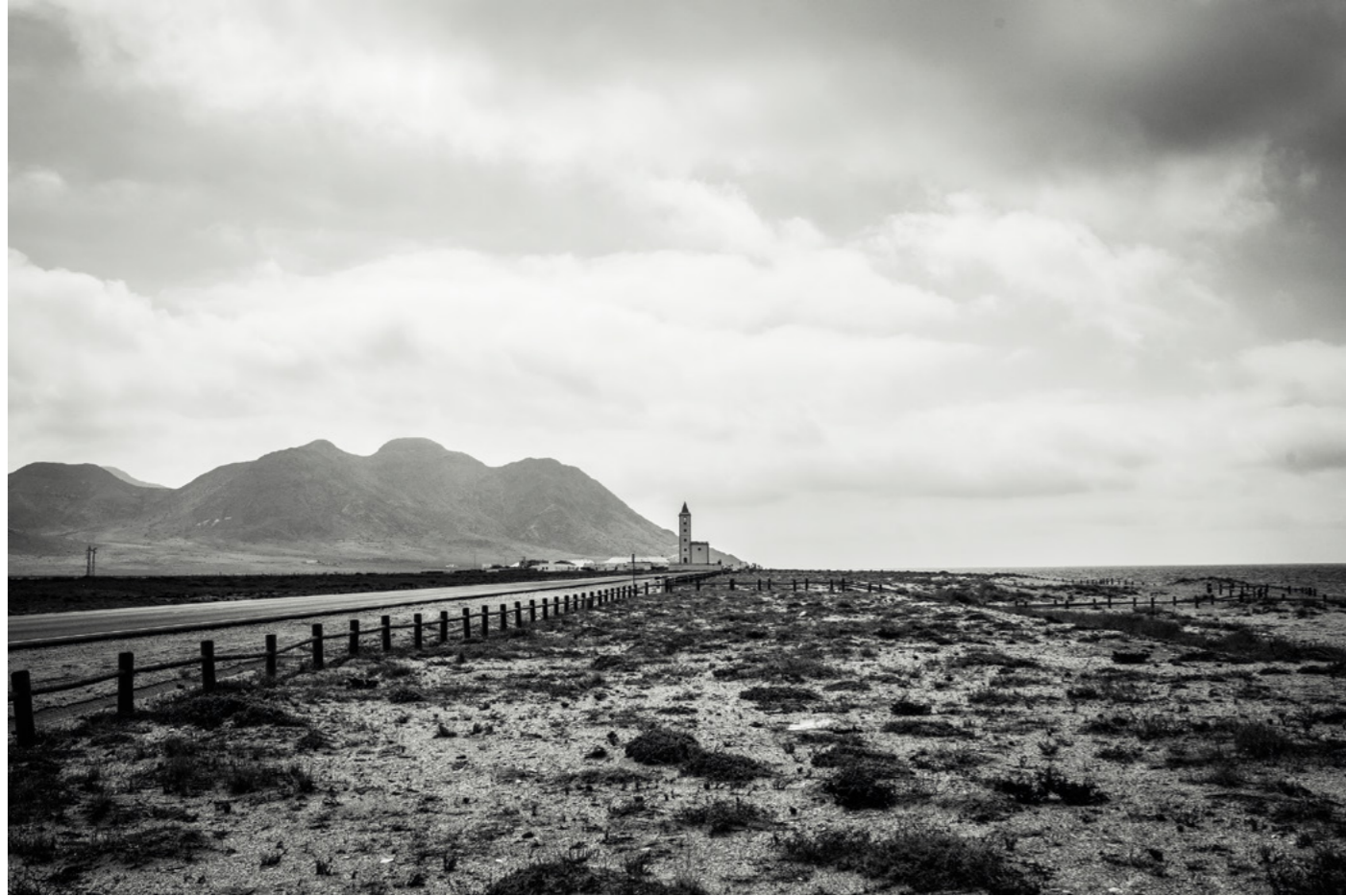
ALMERÍA CABO DE GATA ESTADO PURO