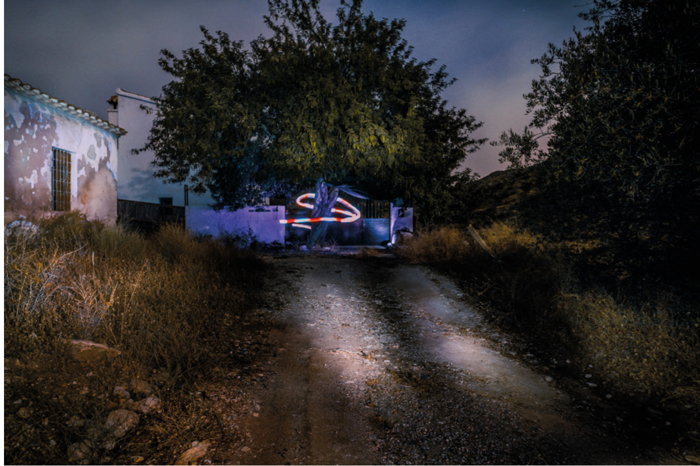
LOS AMANTES DE LUBRÍN