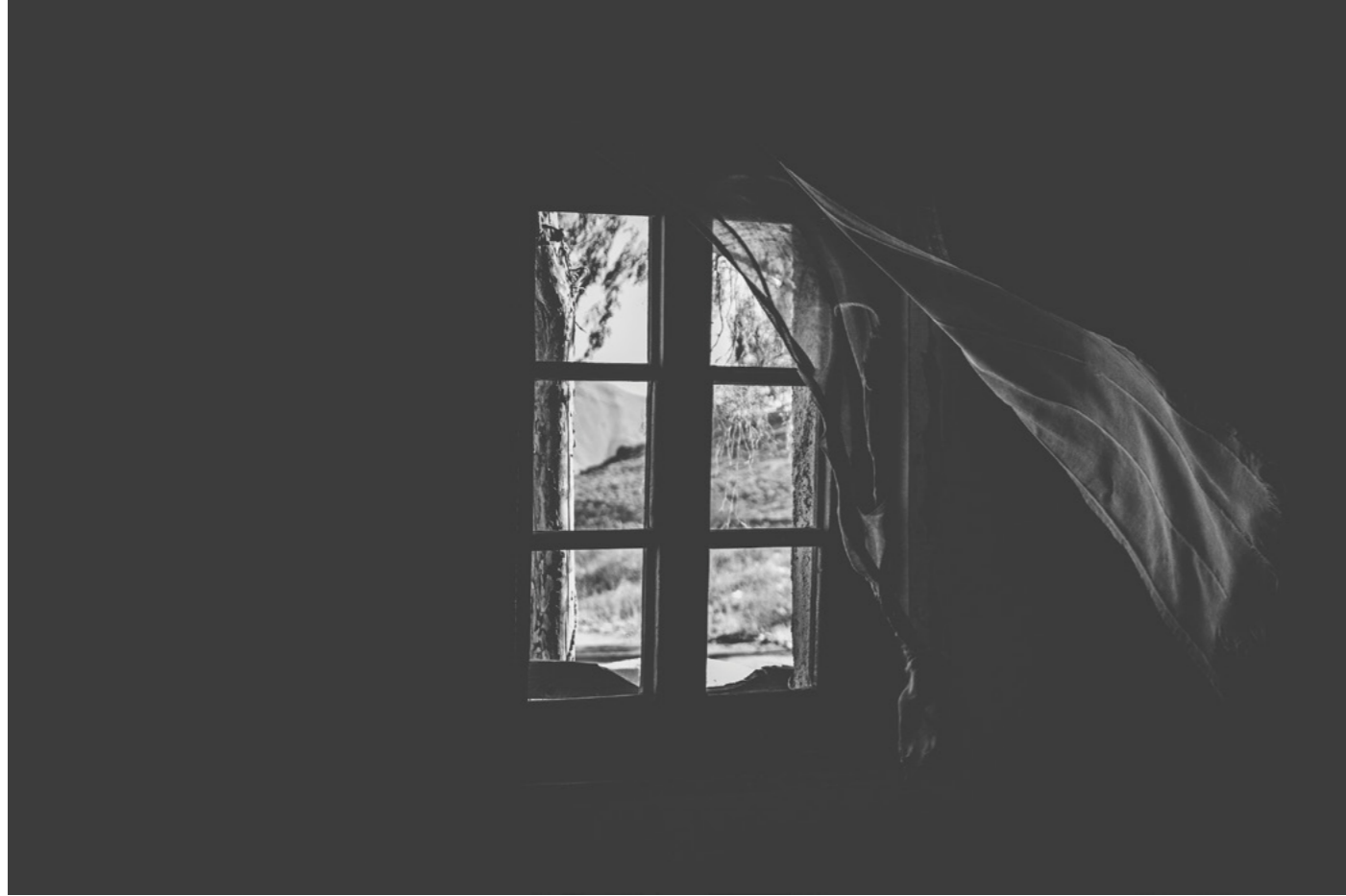
RIDERS ON THE STORM