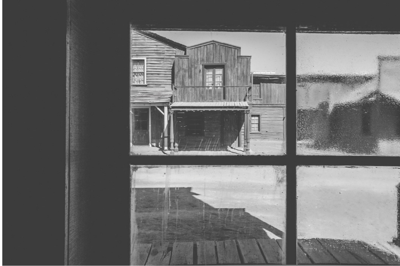
RIDERS ON THE STORM