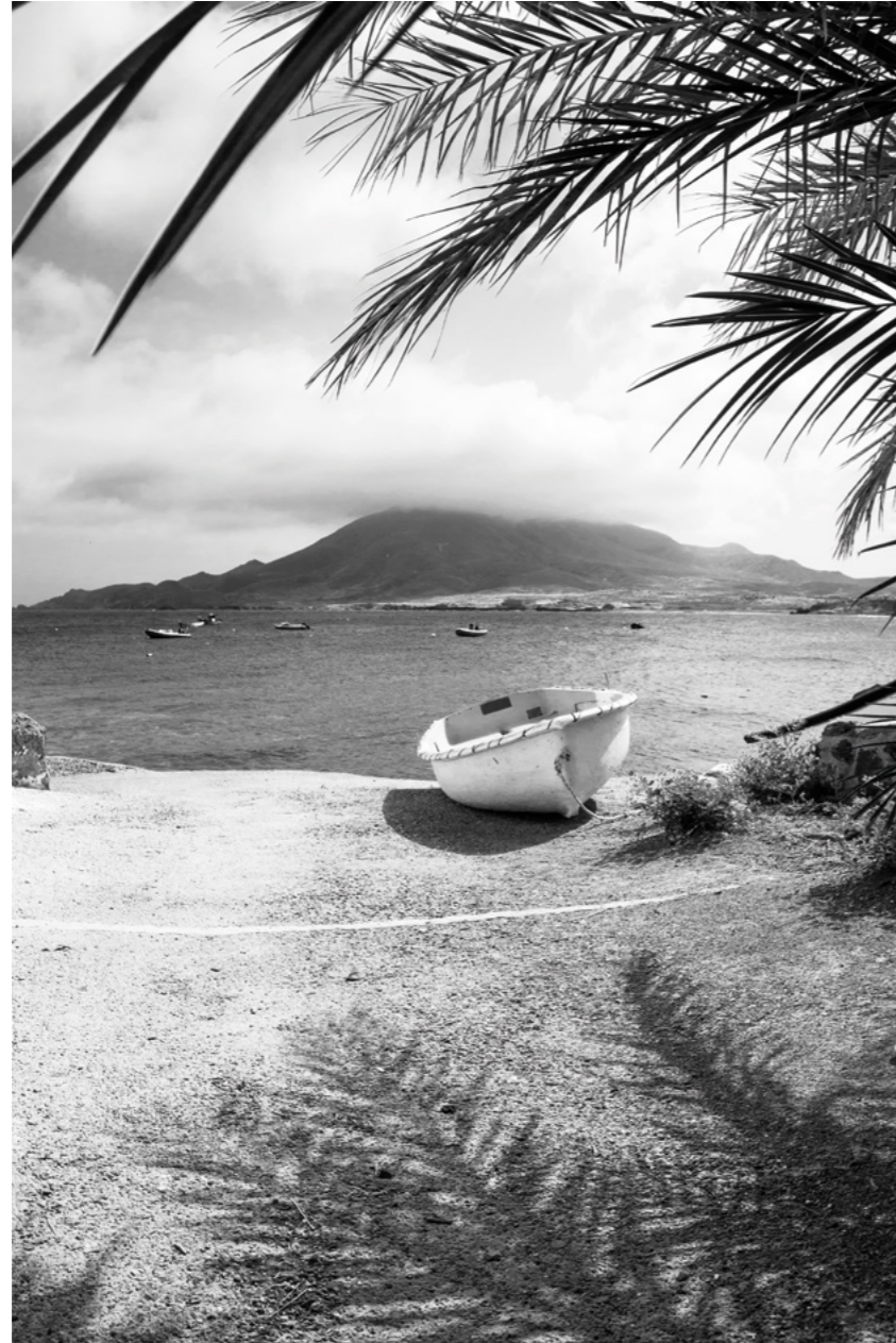
PLANOS EN EL CABO